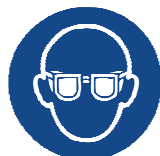
Lunettes de protection hermétiques