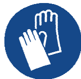
Gants de protection

À cause du manque de tests, aucune recommandation pour un matériau de gants pour le produit / la préparation / le mélange de produits chimiques ne peut être donnée. Choix du matériau des gants en fonction des temps de pénétration, du taux de perméabilité et de la dégradation.